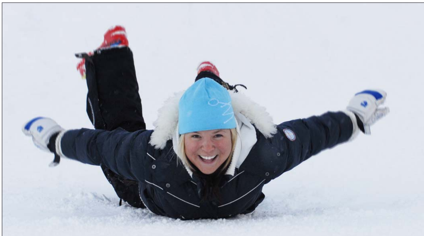
Anja Pärson, flerfaldig världsmästare i Åre 2007, visar sin egen kollektion från Seger.